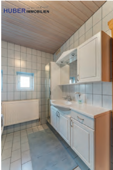
Bad im EG