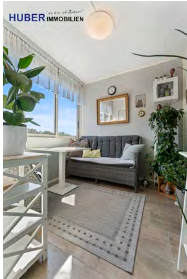
Loggia - Glasflächen aufschiebbar