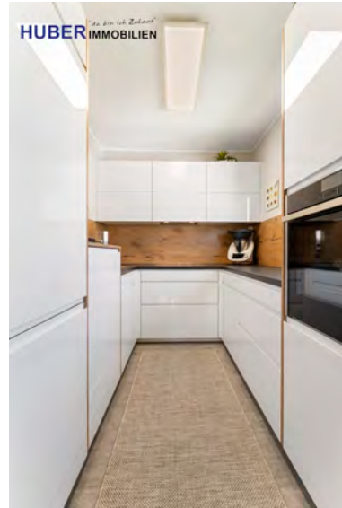
moderne, helle Küche